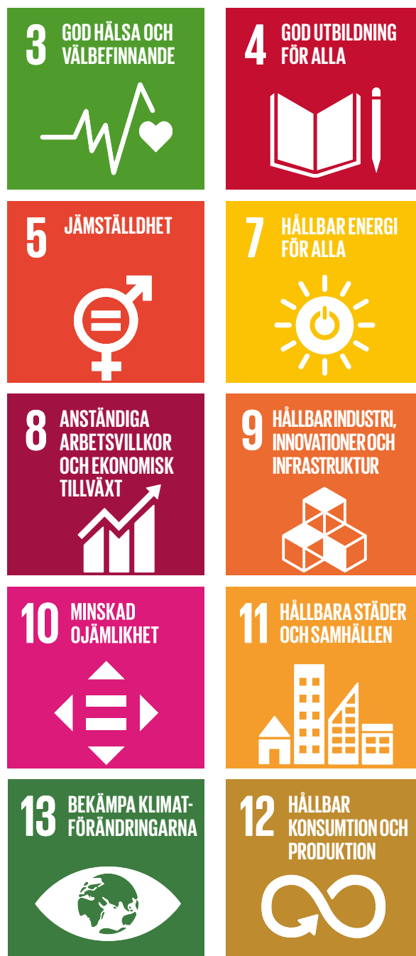
Bild: De globala målen i Agenda 2030

De mål som enligt väsentlighets- och intressentanalysen har störst koppling till kollektivtrafiken är: