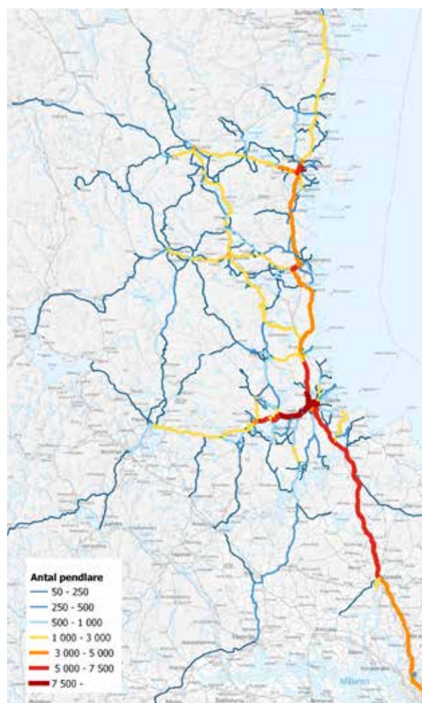
Figur 1: Kartan illustrerar pendlingsmönster om resan skulle ske via snabbaste vägen i vägnätet. Pendlingen beräknas utifrån bostadens belägenhet och arbetsställens samt lärosätens belägenhet. Observera att det inte behövs betyda att pendlingen sker dagligen. En stor del av pendlingen på vissa sträckor sker via tågnätet och inte vägnätet som kartan visar. Statistiken gäller 2019.

Kartan visar pendlingsmönster inom Gävleborgs län baserat på bostadsrespektive arbets- eller studieort.